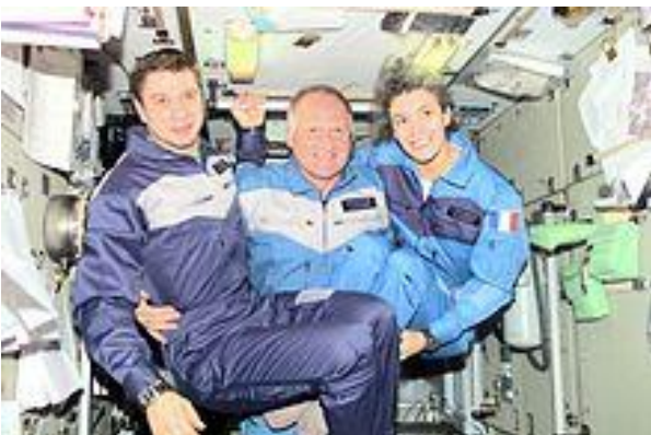
Claudie Haigneré à bord de la Station spatiale internationale.