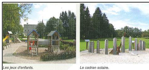
Les jeux d'enfants.