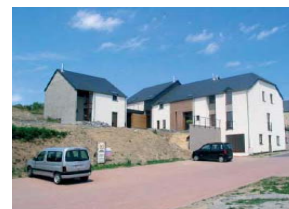
Exemple de logement tremplin à Martelange

Logement intergénérationnel : logements conçus et aménagés – par un pouvoir public – pour accueillir simultanément, des locataires jeunes et des locataires âgés, en encourageant et en facilitant les interactions entre eux, notamment, l'échange de services.