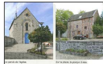
Le parvis de l'église.