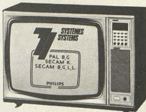
TV COULEUR : PRISE PERITEL

Une technologie de pointe appliquée à toute sa gamme.