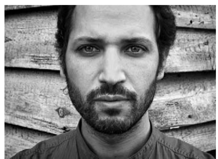
Jawhar donnera un concert pour l'occasion.

à noter Le 25 avril à 18 h aux Jardins de Choiseul, avenue Bozière à Tournai. Infos : www.lire-et-ecrire.be ou sur leur Facebook.