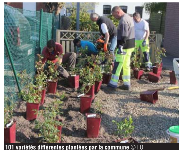
101 variétés différentes plantées par la commune