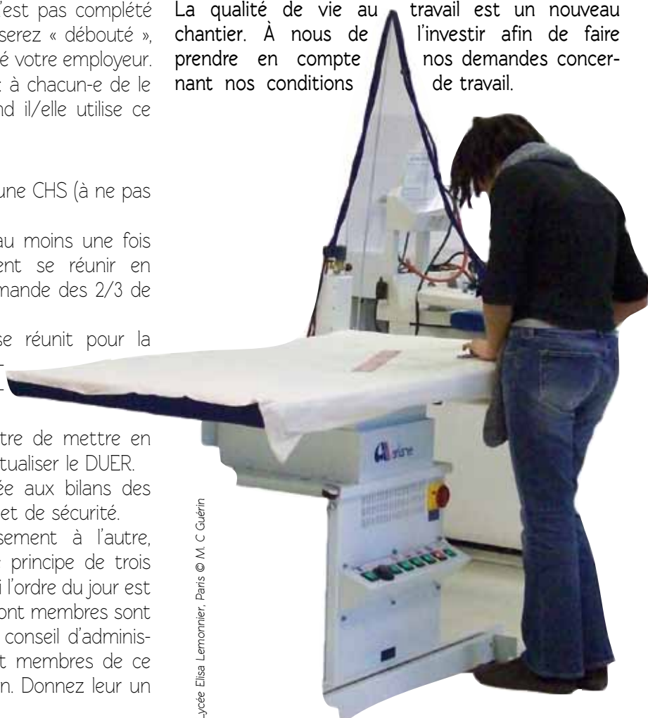
Lycée Elisa Lemonnier, Paris

La qualité de vie au travail est un nouveau chantier. À nous de prendre en compte nos demandes concernant nos conditions de travail.