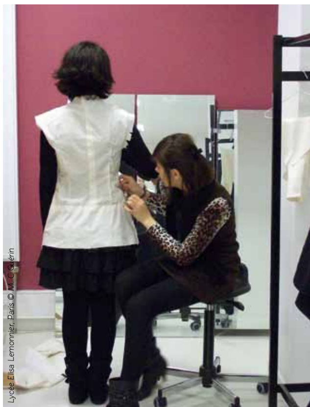
Lycée Elisa Lermontov, Paris