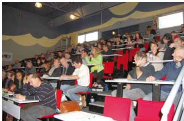
© Bernard Soterias - Lycée des Iris, Lormont (33), 12 novembre 2013, 85 participants.

D'ailleurs, l'ensemble des participant-es a regretté l'absence de visites médicales régulières et institutionnalisées.