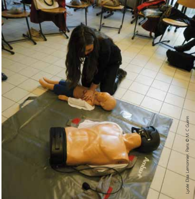
Lycée Elisa Lemonnier, Paris © M. C. Guérin