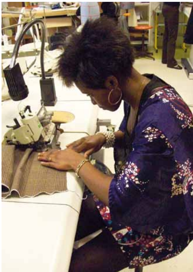
Lycée Elisa Lemonnier, Paris

Pour le SNUEP-FSU, l'ouverture des ESPÉ s'est faite dans l'urgence, sans garantie de moyens et souvent sans écouter les propositions des formateurs et des usagers. Le volume horaire de formation a diminué. Les nouveaux concours et les parcours de formation ne garantissent pas la prise en compte de toutes les spécificités des PLP, notamment la bivalence des enseignements généraux ou l'absence dans certaines spécialités professionnelles de licences voire de BTS. Les futur-es PLP au meilleur des cas se retrouvent dans des MEEF (1) avec CAPES ou CAPET, presque sans distinction de formation.