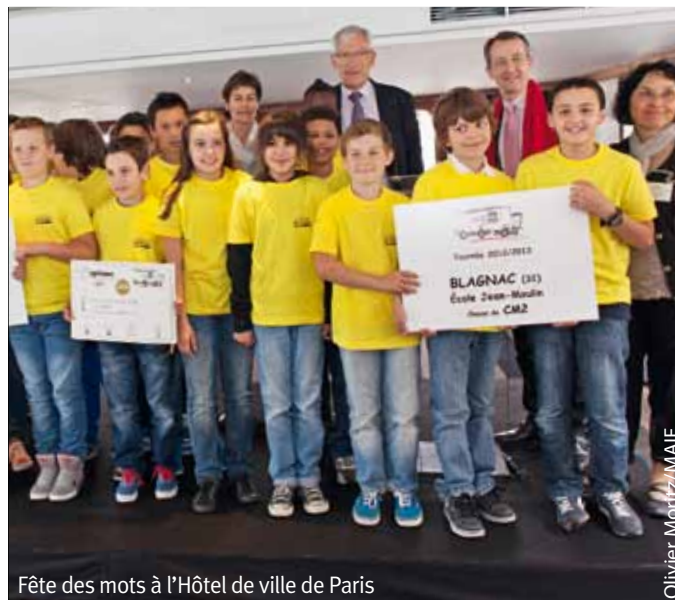
Fête des mots à l'Hôtel de ville de Paris