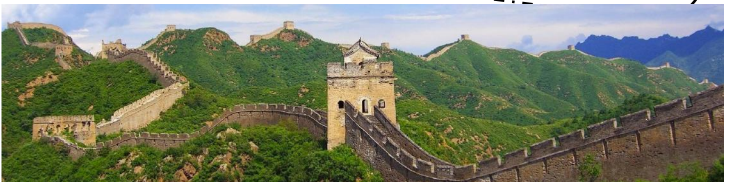
La Grande Muraille de Chine