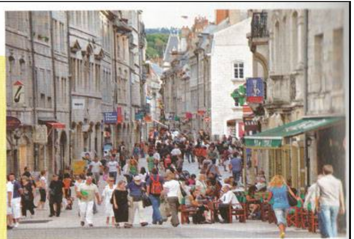
La Grande-Rue, Besançon (Doubs).

D'après une enquête effectuée par l'institut de sondage CSA en 2012.