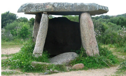
Document 5 : Mégalithes : dolmen et menhir