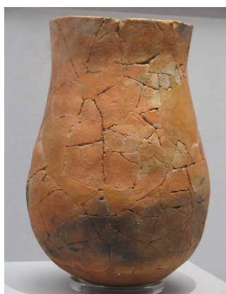
Document 4 : Poterie