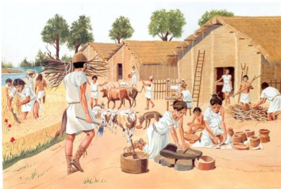
1. Reconstitution du village de Cuiry-les-Chaudardes dans l'Aisne (vers 4 000 avant J.-C.).