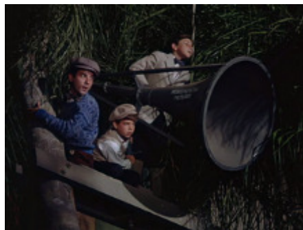
Voix in mais désincarnée