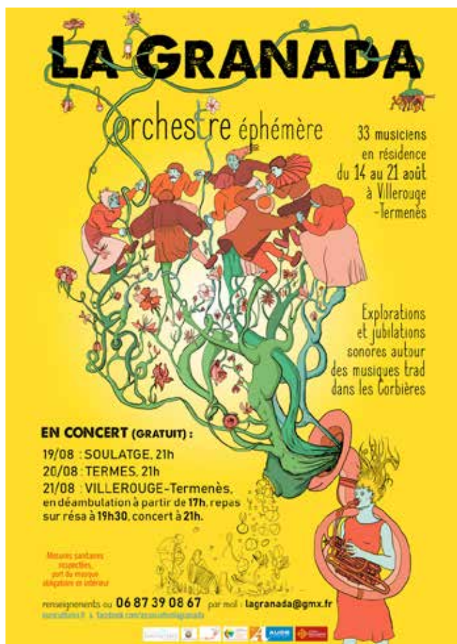
Affiche de l'orchestre éphémère 2020.

Depuis l'année 2021, elle poursuit ses projets en autonomie avec notamment l'organisation de l'Affût (une balade artistique et poétique sur l'Espace Naturel Sensible de Borde Grande à Laroque-de-Fa), l'orchestre éphémère #2, des ateliers de chants, de fanfare sauvage, des concerts et aussi participe à l'organisation du premier Carnaval en Corbières en mars 2024.