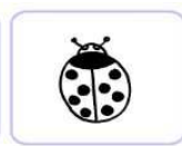
trois coccinelles rouges