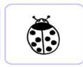
trois coccinelles rouges