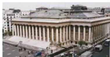
Bourse de Paris