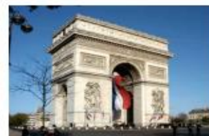
Arc de triomphe de l'étoile