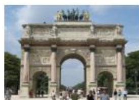
Arc de triomphe du carroussel