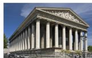
Eglise de la Madeleine