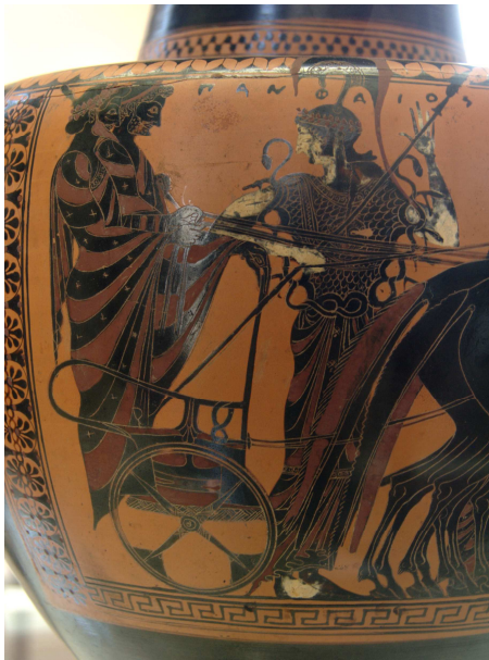
Heracles et Iolaos montés sur un char escorté par Athéna