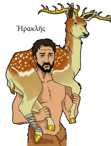
Héraclès et la biche de Cérynie