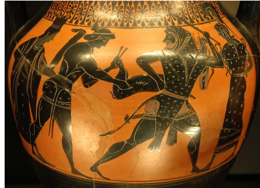
Héraclès capturant la biche de Cérynie

Iolaos : fils d'Iphiclès et neveu d'Héraclès. Il est l'un des plus fidèles compagnons de son oncle Héraclès dont il conduit traditionnellement le char.