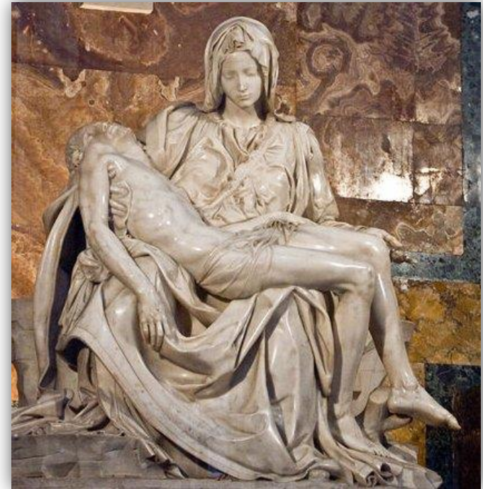
Sculpture : La pieta