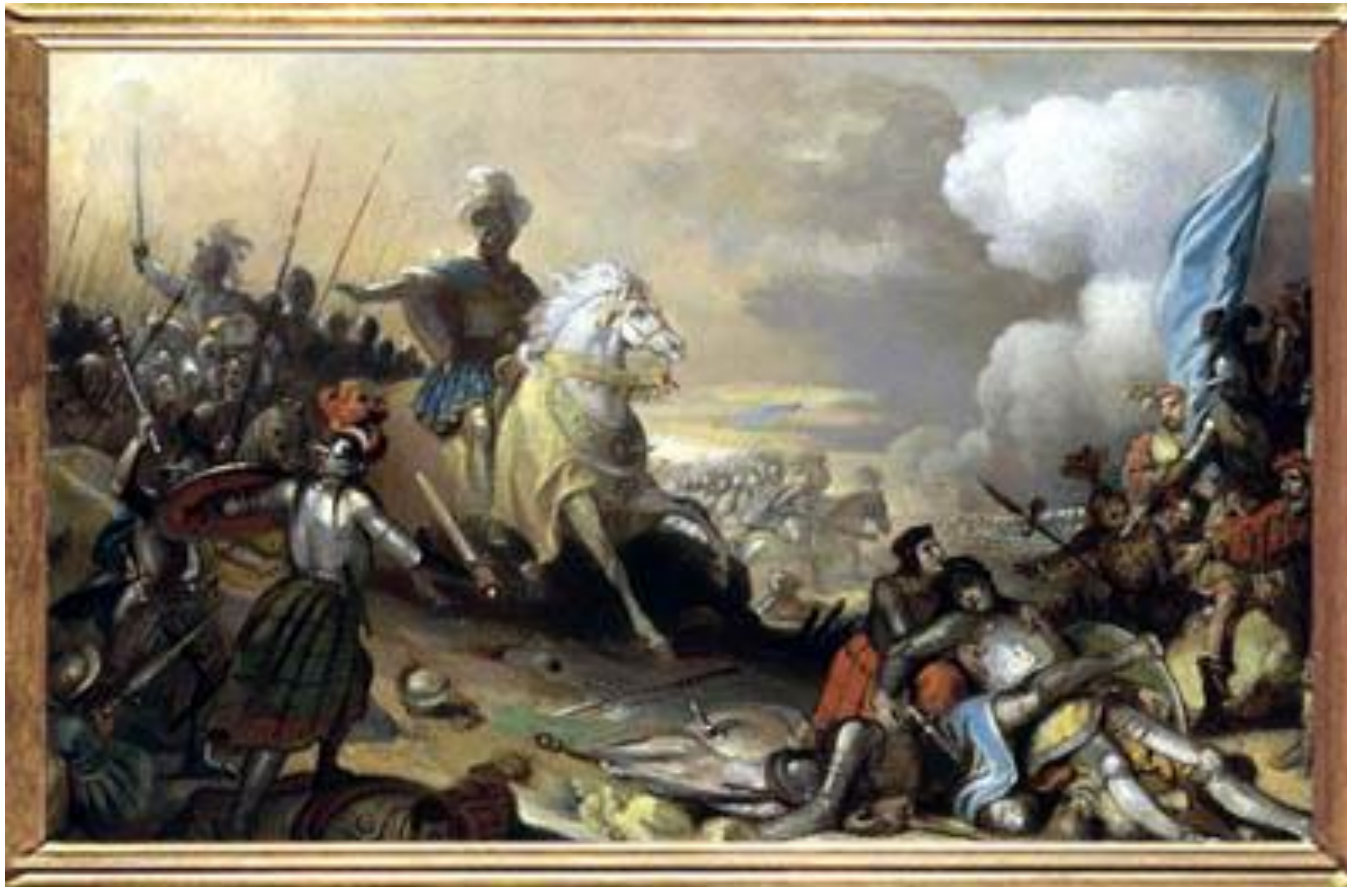
Tableau exposé au château de Versailles

gagnée par François 1er, le 14 septembre 1515.