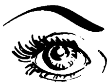
l'œil les yeux