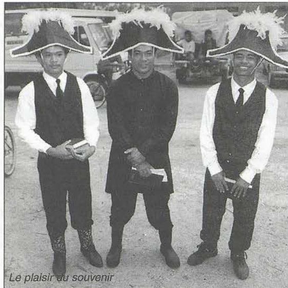
Le plaisir au souvenir

Mais la réponse vient de Maroe qui rassemble au son de la cloche les fidèles pour la reconstitution d'un culte. Taarua n'est pas pour autant réduit au silence et fait doubler la pluie qui couvre la prédication. On peut-être n'était-ce qu'un signe pour ne pas oublier de se méfier des ondées du mois de mars. Ce ne sera pas le seul signe. La longueur des sketches éparpillera le public avant la fin, les uns rentrant chez eux, d'autres discutant à l'écart et certains jeunes trouveront refuge