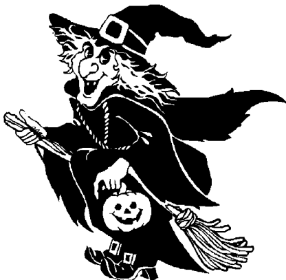
10 - Sorcière