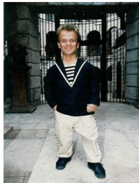
8 - Nain