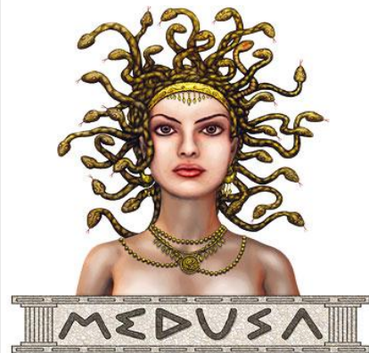
11 - Gorgone