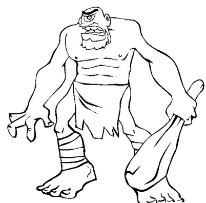
12 - Cyclope