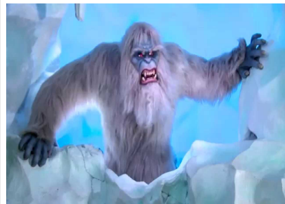
5 - Yeti