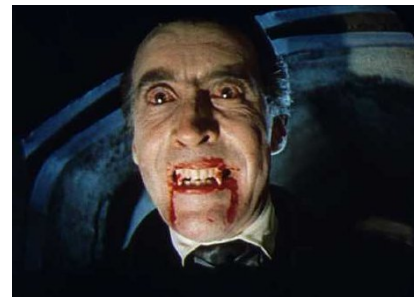
6 - Vampire