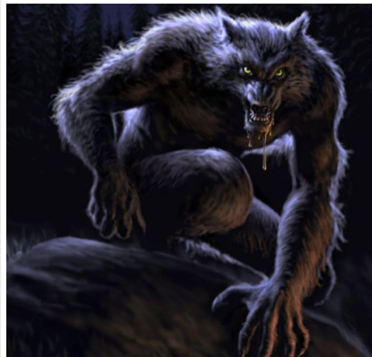
2 - Loup-garou