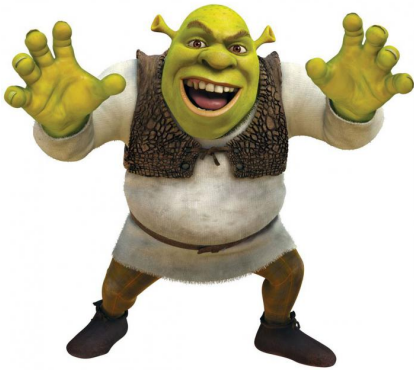
1 - Shrek

Voici 12 images qui représentent des monstres. A toi de faire 6 paires. Pour chacune d'entre elles, écris une phrase pour expliquer tes choix. Toutes les images doivent être utilisées.