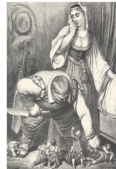
9 - Ogre