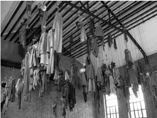
Document 3 : la salle des pendus. (Lewarde)

Quand les mineurs se changeaient, ils utilisaient des vestiaires particuliers. Ils accrochaient leurs vêtements, leurs chaussures, leur sac à une longue corde. Cette corde était accrochée au plafond d'une grande salle : la salle des pendus. Le mineur remontait la corde avec ses habits ou la descendait. Il pouvait la fixer avec un cadenas pour qu'on ne lui vole pas ses affaires. Là haut, les habits séchaient grâce aux souffleries d'air.