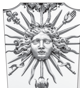
Doc. 4 Motif sur la grille d'enceinte du château de Versailles.