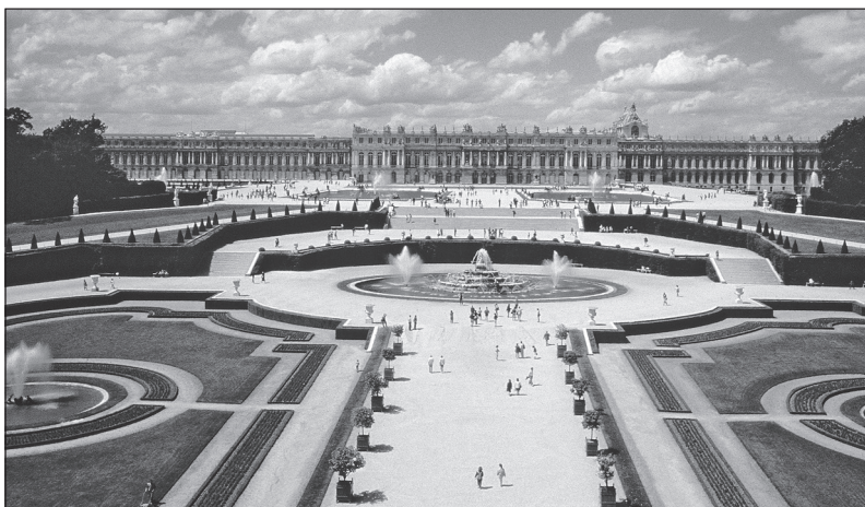
Doc. 2 Le château de Versailles et ses jardins.