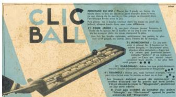
Boite du clic-ball

On le trouve dans les catalogues de jeux et jouets des années 40-50.