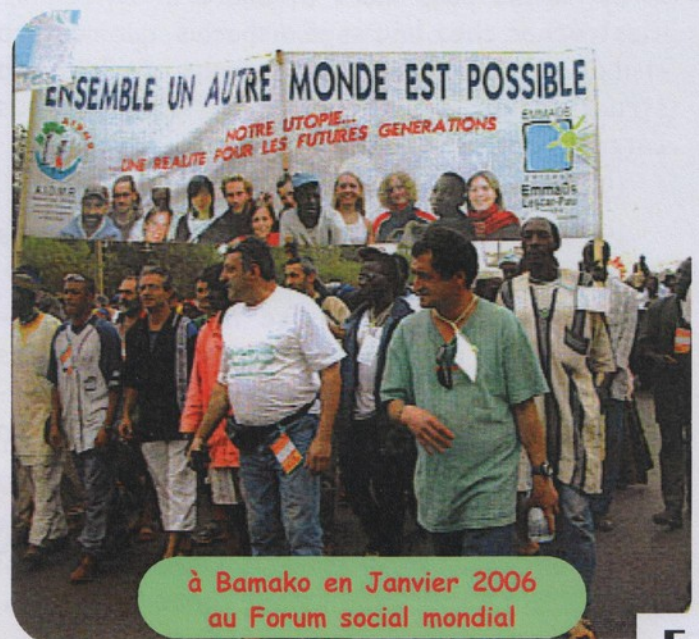
à Bamako en Janvier 2006 au Forum social mondial

Page 102 : Je ne sais pas ce que nous trouverons au bout de ce chemin, mais il n'y en a pas d'autres possibles. En plus, je jouis d'une grande richesse et même d'un luxe : aujourd'hui, 30 ans après, je suis toujours investi de la même utopie : "Oser risquer l'utopie avec et pour l'Homme !"