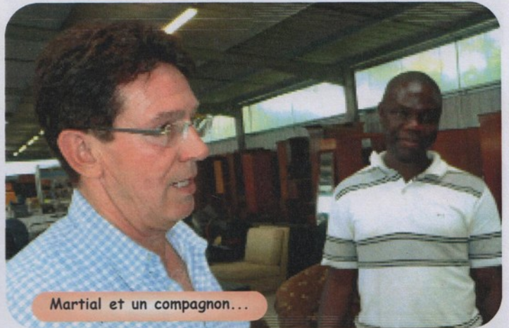
Martial et un compagnon...