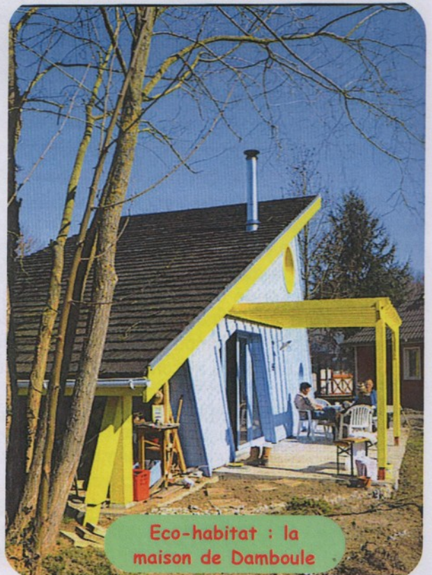
Eco-habitat : la maison de Damboule