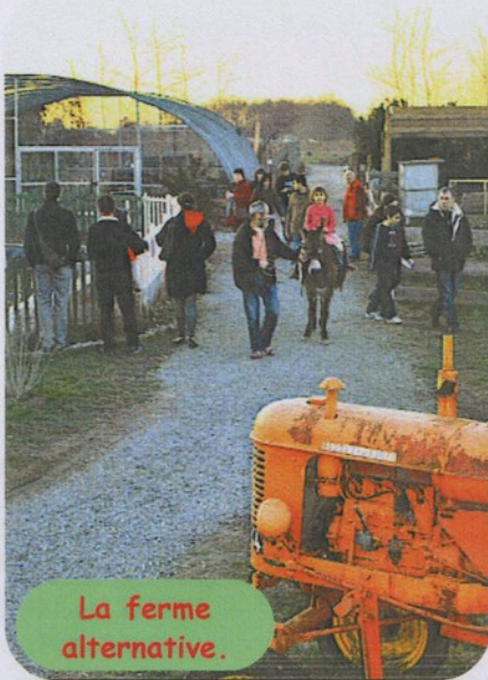
La ferme alternative.