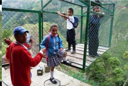
Colombia (región andina)

¿Cómo van a la escuela? ¿Qué tienen que hacer para ir a la escuela? van a la escuela a pie. Tienen que caminar por la selva. Tienen que atravesar la selva. Van a la escuela a caballo y en 'tarabita'. Tienen que atravesar el río