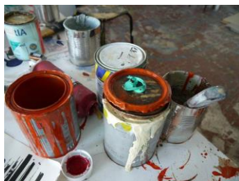
Le pot de peinture

Le pot de peinture La batterie de voiture La pile Les gravats La cartouche La console