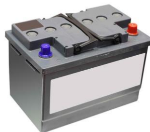
La batterie de voiture

Le pot de peinture La batterie de voiture La pile Les gravats La cartouche La console