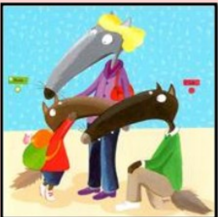
P'tit Loup est inquiet et il ne veut pas laisser ses parents.

Il y a un livre, qui est tenu par quelqu'un sur ses genoux, qui le montre. C'est la maîtresse.