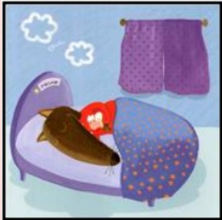
P'tit Loup fait la sieste dans le dortoir.

Que vois-tu ? Il y a un nuage blanc sur le mur bleu, et le morceau d'un rideau violet qui est tiré pour empêcher le jour de rentrer.