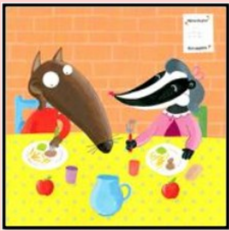
P'tit Loup mange à la cantine avec sa nouvelle copine.

Que vois-tu ? Il y a une carafe, un verre, une pomme et une assiette avec de la nourriture.