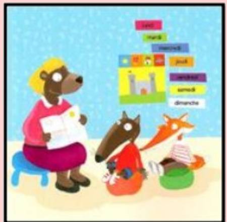
La maîtresse a pris un livre pour lire des histoires.