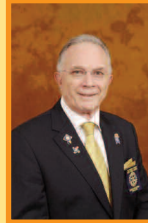
Jean-Pierre RIVIÈRE Gouverneur D9220