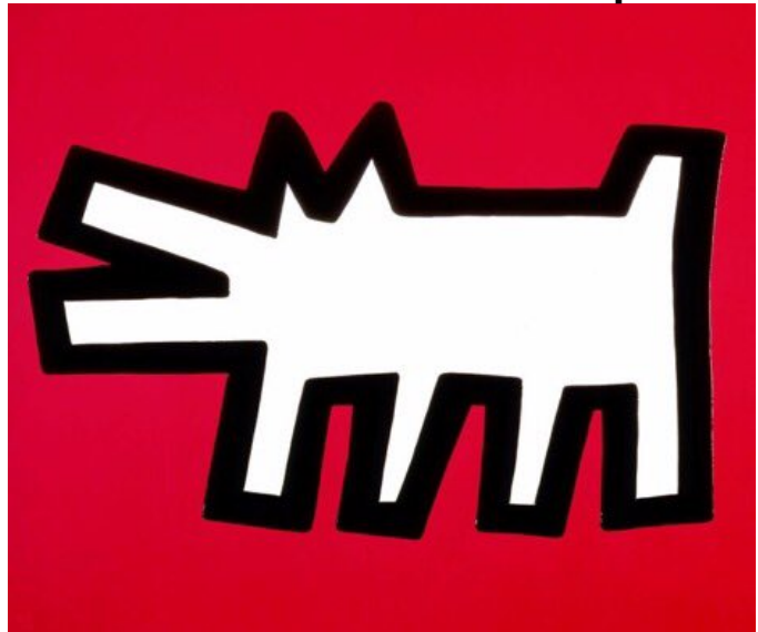
Barking Dog, 1990