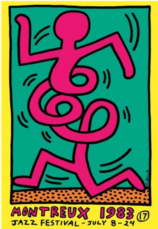
Affiche Montreux Jazz Festival, 1983