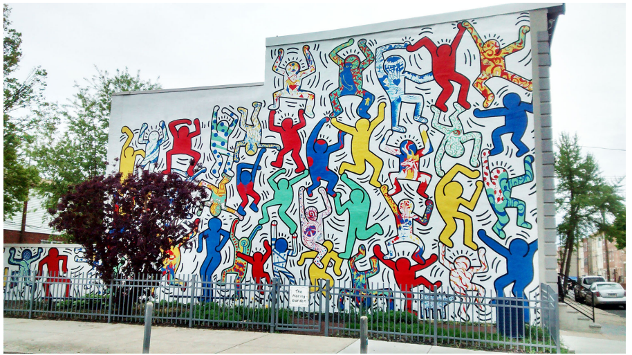
We Are The Youth - Philadelphie - 1987