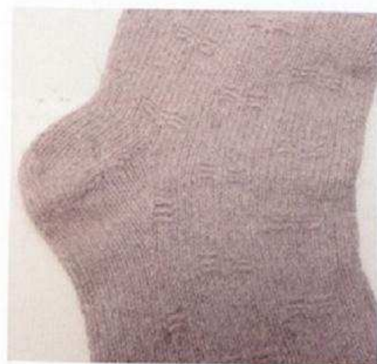
Le modèle peut être tricoté avec des aiguilles à double pointe ou avec une aiguille circulaire. Le talon est la seule partie réalisée en rangs linéaires, le reste de la chaussette est tricoté en rond.