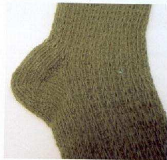
Le modèle est tricoté avec des aiguilles à double pointe et le talon est renforcé grâce à un point de mailles glissées et de mailles tricotées ensemble.