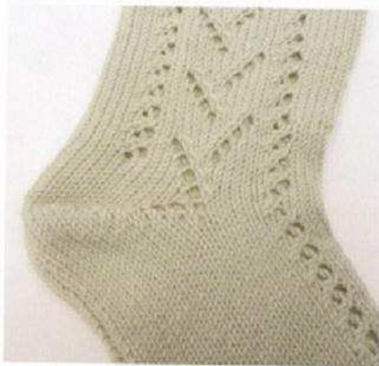
Le modèle est tricoté à deux aiguilles, le talon est travaillé en rangs raccourcis.

Pour ajuster la circonférence d'une chaussette, il faut modifier le nombre de mailles. Mesurez le tour de cheville, à l'endroit de l'articulation. Tricotez un échantillon et multipliez la taille de la cheville par le nombre de mailles par centimètre de l'échantillon. Arrondissez le résultat au nombre entier le plus proche. Vous obtenez le nombre de mailles nécessaires à cet endroit de l'ouvrage.