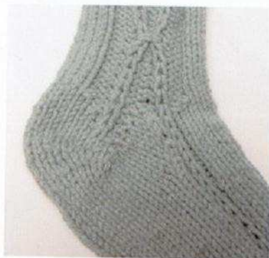
Le modèle est réalisé sur une aiguille circulaire, le talon est renforcé grâce à un point de mailles glissées torsées.