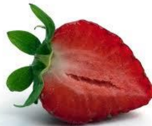
Coupe de la fraise