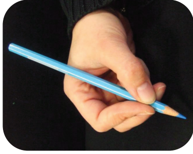
Le crayon est posé sur la première phalange du majeur.