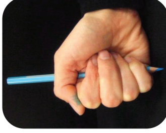
Crayon tenu par tous les doigts