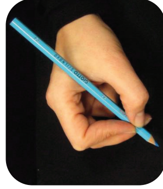
Le haut du crayon est posé dans le creux entre le pouce et l'index.