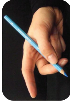
Ce n'est pas l'index qui pince, il dirige.

L'auriculaire et l'annulaire sont repliés dans le creux de la main. Ils servent d'appui. Le crayon est posé sur le majeur et le creux entre le pouce et l'index. Ensuite, le pouce vient pincer le crayon. Le crayon tient alors, même avec l'index levé. L'index vient, en dernier, se poser sur le crayon et sert juste à diriger. Les doigts ne sont ni trop près, ni trop loin de la mine.