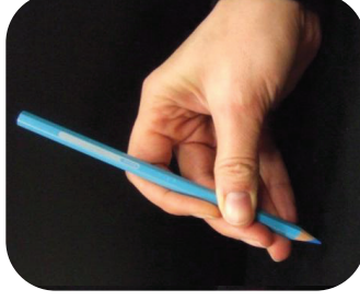
Tous les doigts au dessus et le pouce en opposition