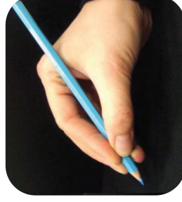
Majeur sur le crayon