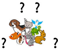
Have you got a... ?