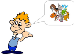
I have got...