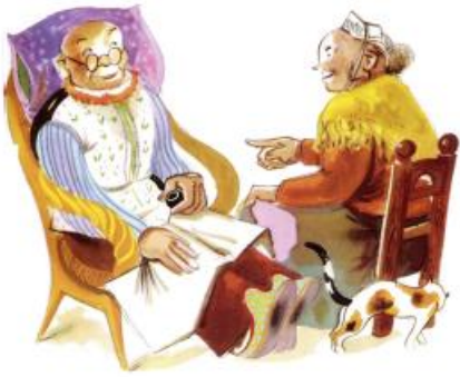
Le vieux et la vieille