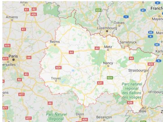
carte de la région Grand Est

Retenons que notre région est composée de 10 départements : Ardennes (10), Marne (51), Aube (10), Meuse (55), Haute-Marne (52), Meurthe-et-Moselle (54), Vosges (88), Moselle (57), Bas-Rhin (67) et Haut-Rhin (68).