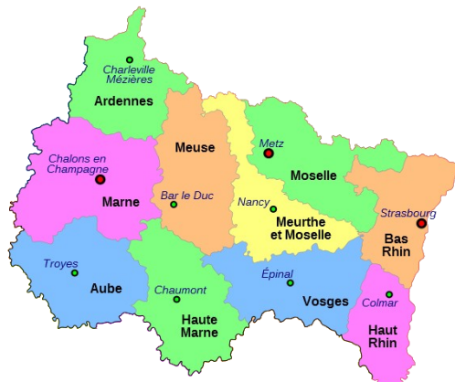
Région Grand Est : les départements

< On peut donc situer notre lieu de vie à différentes échelles : d'abord sur le plan de la ville ou du village, puis dans le département puis la région.