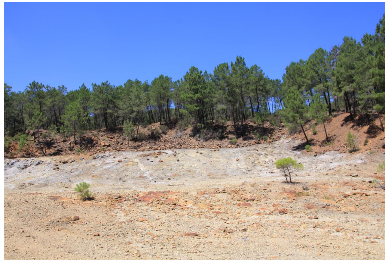
Page 59 - Photo 19 – Zone à nu et à pente très faible