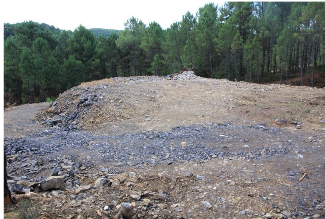
Page 57 - Photo 18 – Vue 3 - Stocks temporaires de déblais de terrassement du Conseil Général sur le secteur sud