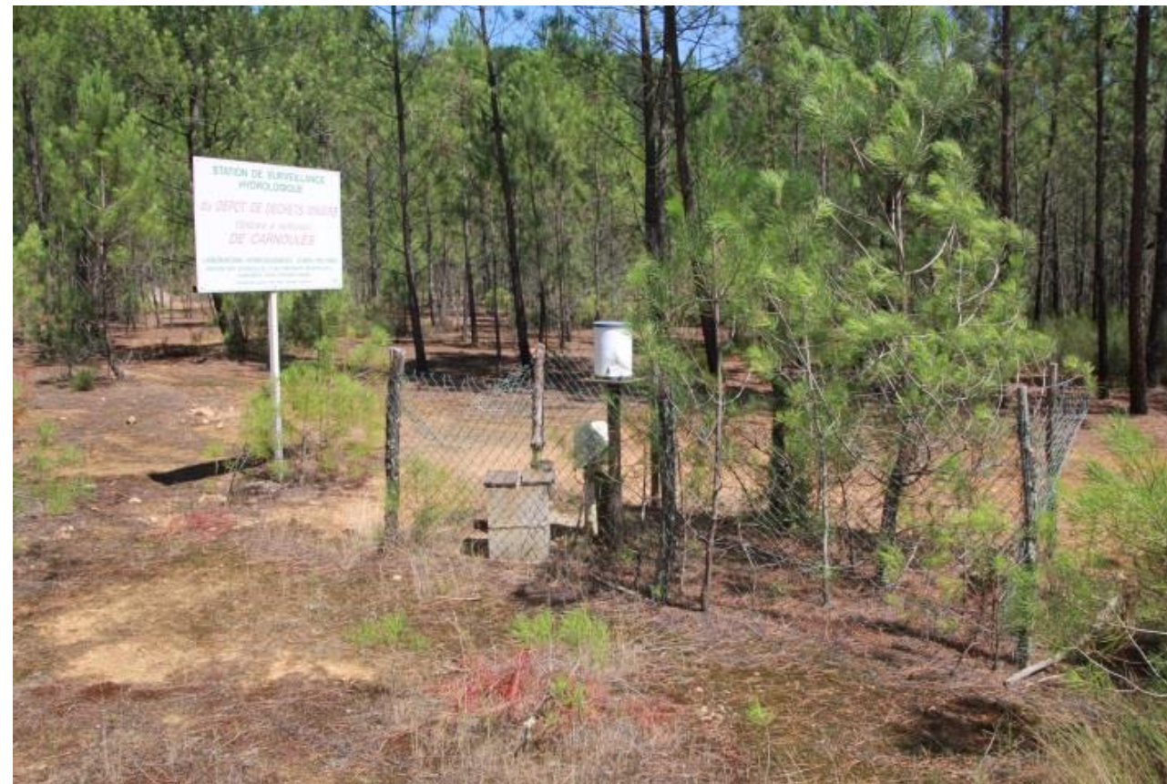
Page 71 Photo 30 – Vue de la station de suivi hydrologique