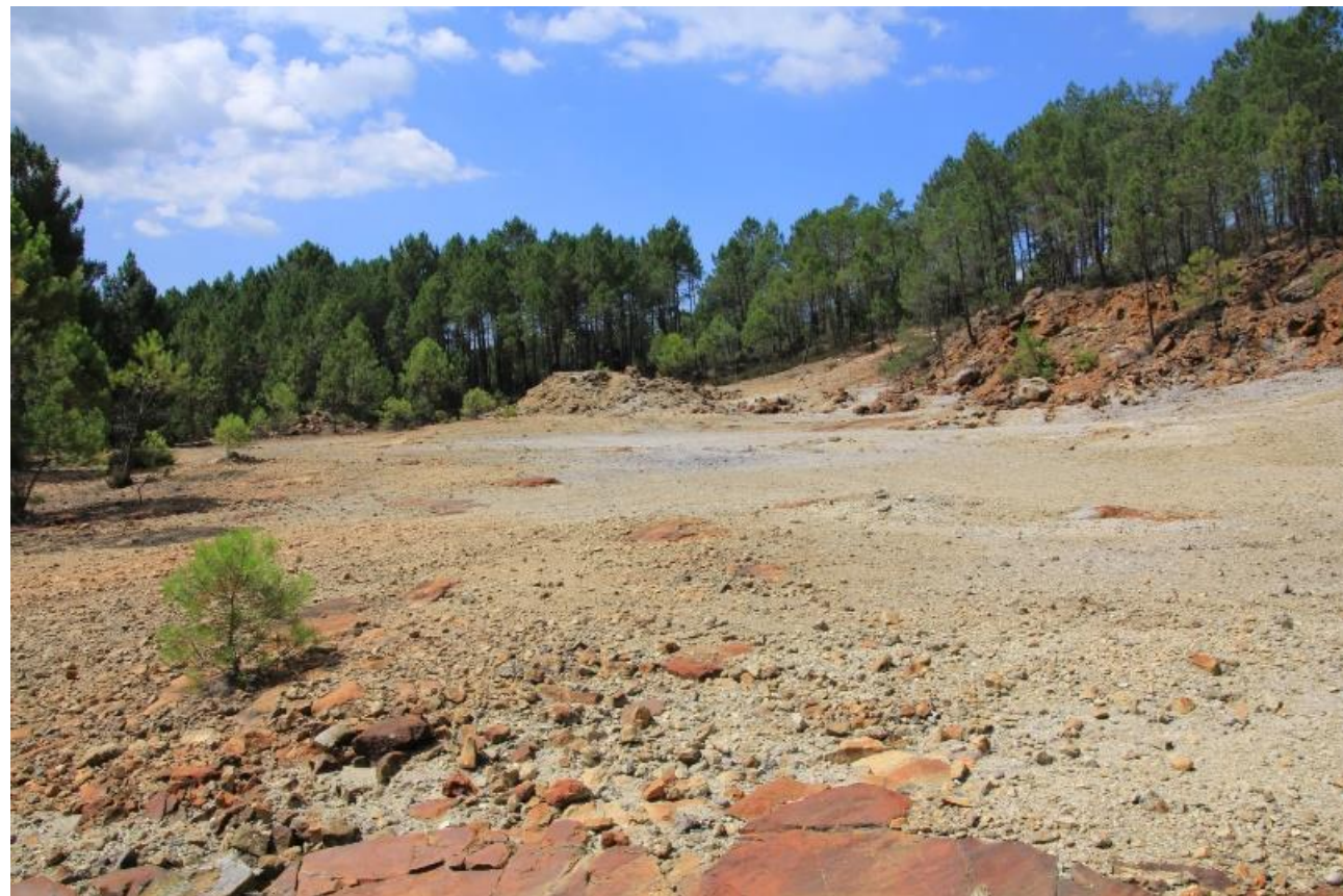
Page 62 - Photo 24 – Vue du site actuel de l'ancienne mine à ciel ouvert