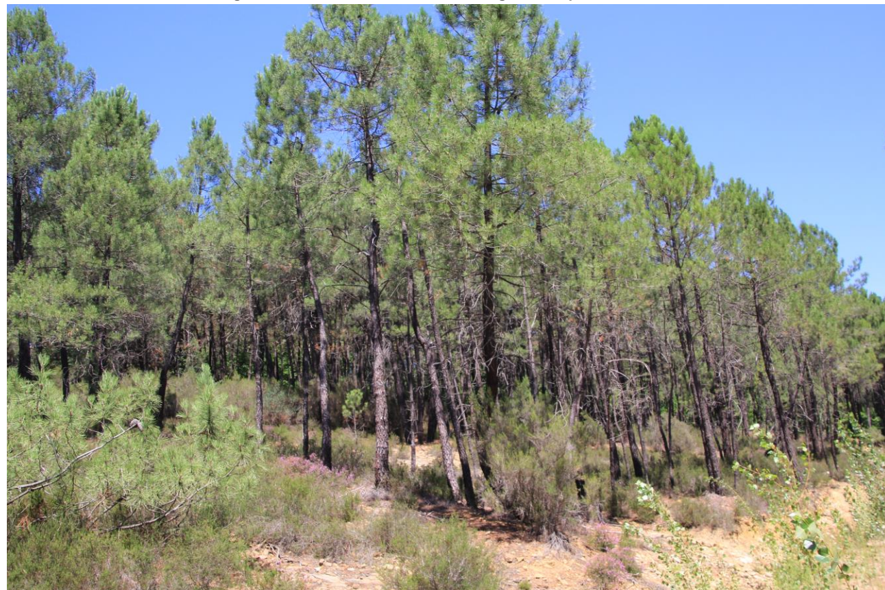
Page 59 - Photo 21 – Zone de couvert végétal (Pin maritime) développé et à forte pente