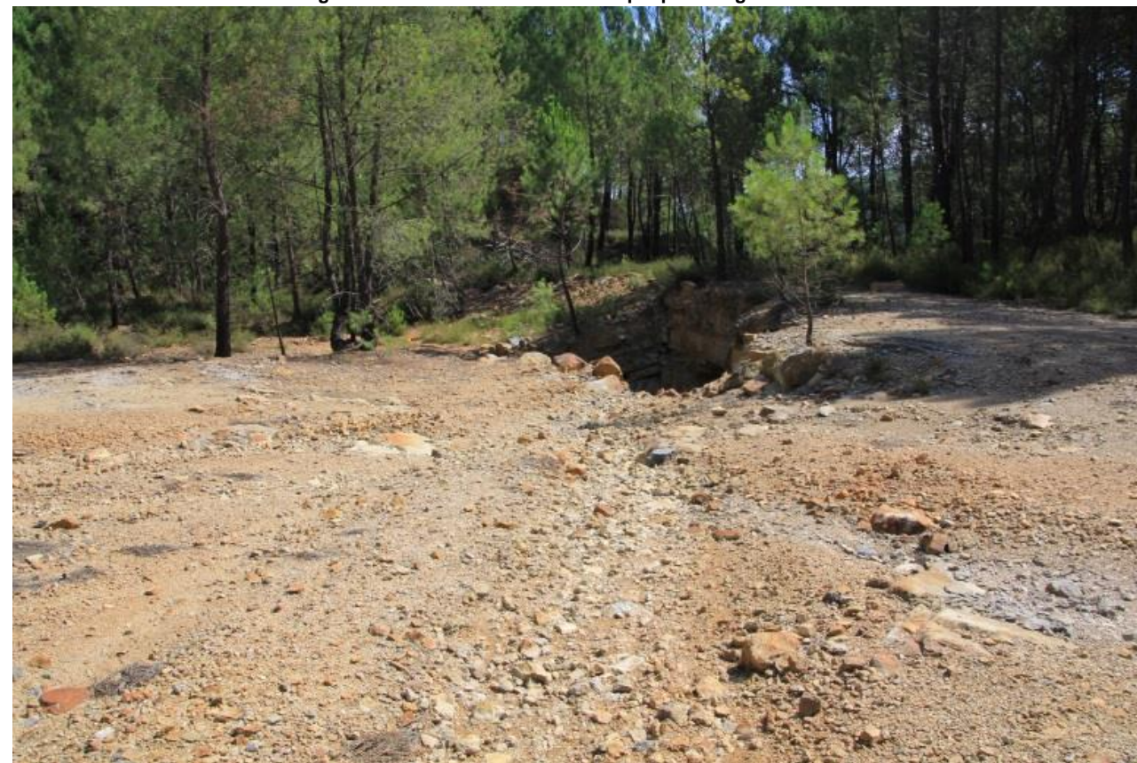
Page 75 Photo 46 – Ruissellement capté par une galerie de mine