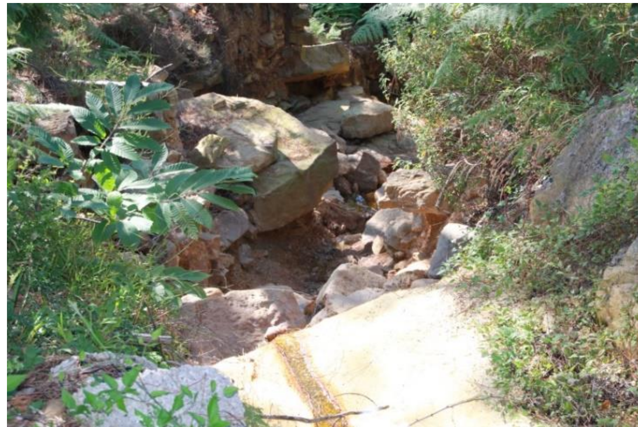
Page 73 Photo 34 – Sortie d'un passage busé sous la RD 217