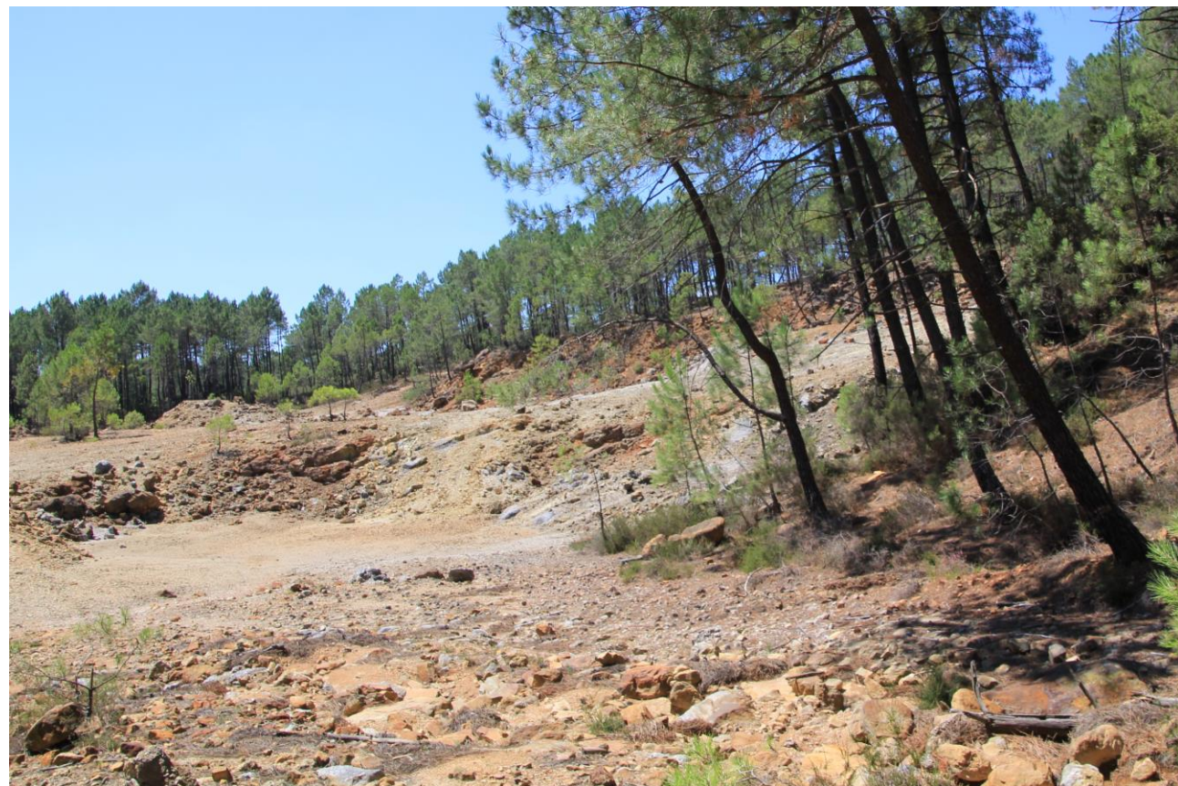
Page 57 - Photo 16 – Vue 1 - Relief général du site (secteur nord) et impact des activités d'extraction à ciel ouvert