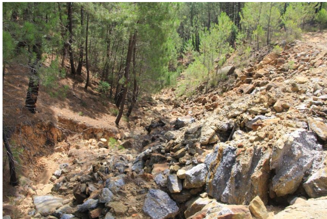
Page 57 - Photo 17 – Vue 2 - Ravines au droit du site