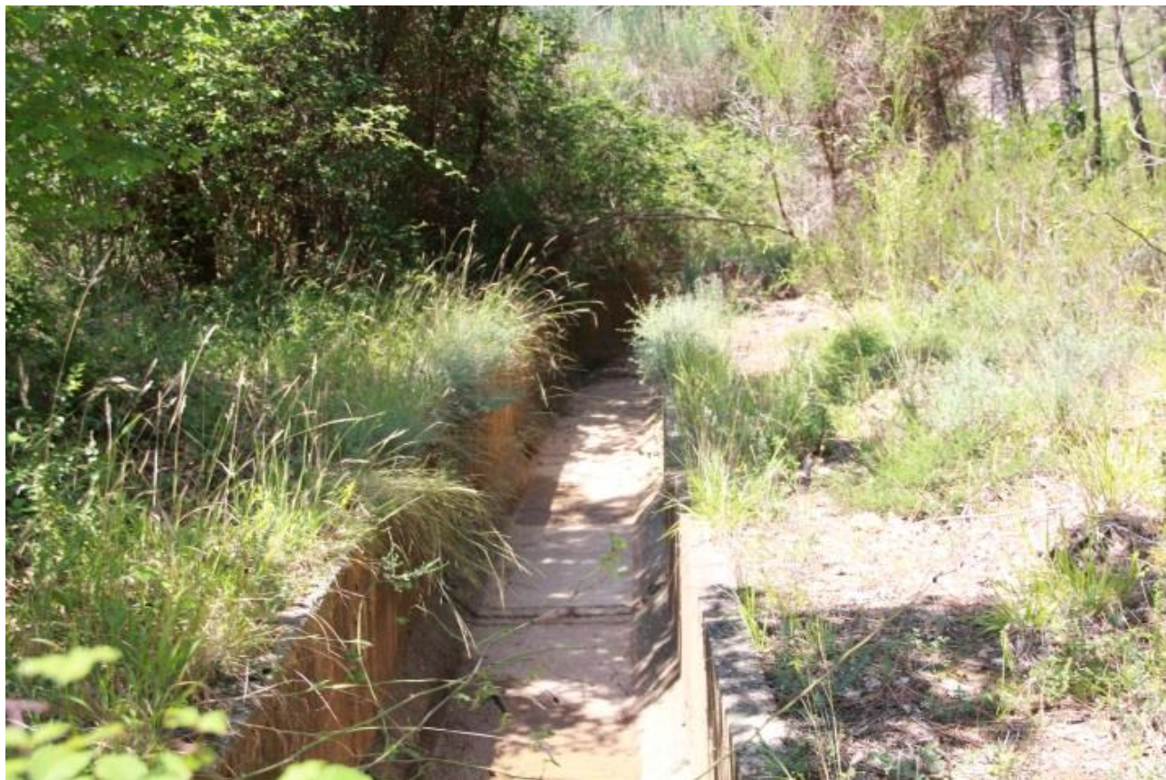
Page 71 Photo 28 – Canal secondaire de gestion des eaux