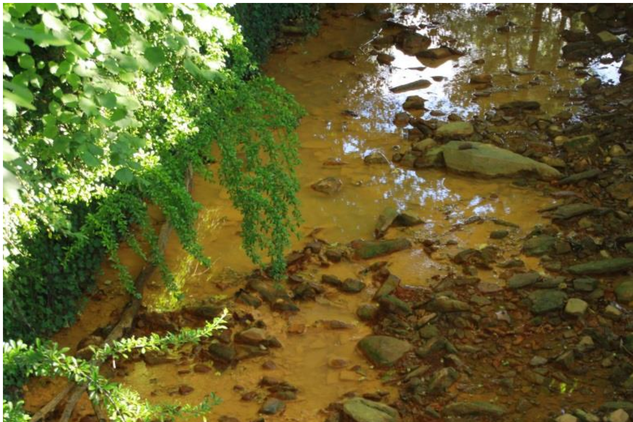
Page 72 Photo 32 – Vue du Réigoux au niveau du hameau « La Fabrègue »