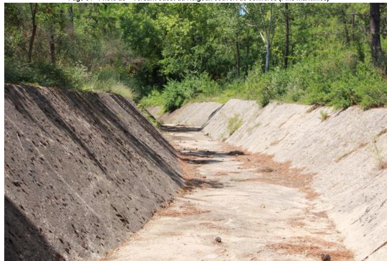
Page 71 Photo 27 – Canal principal de déviation des eaux de ruissellement