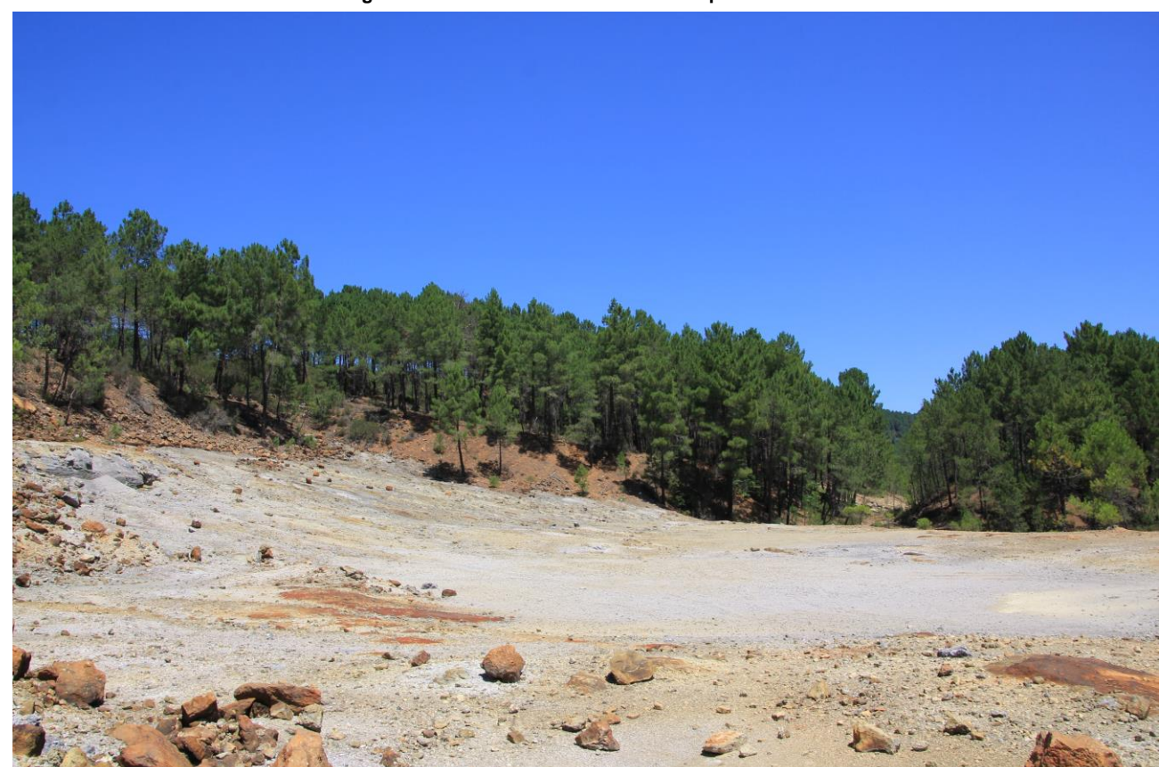
Page 61 - Photo 23 – Sol du carreau d'exploitation nord