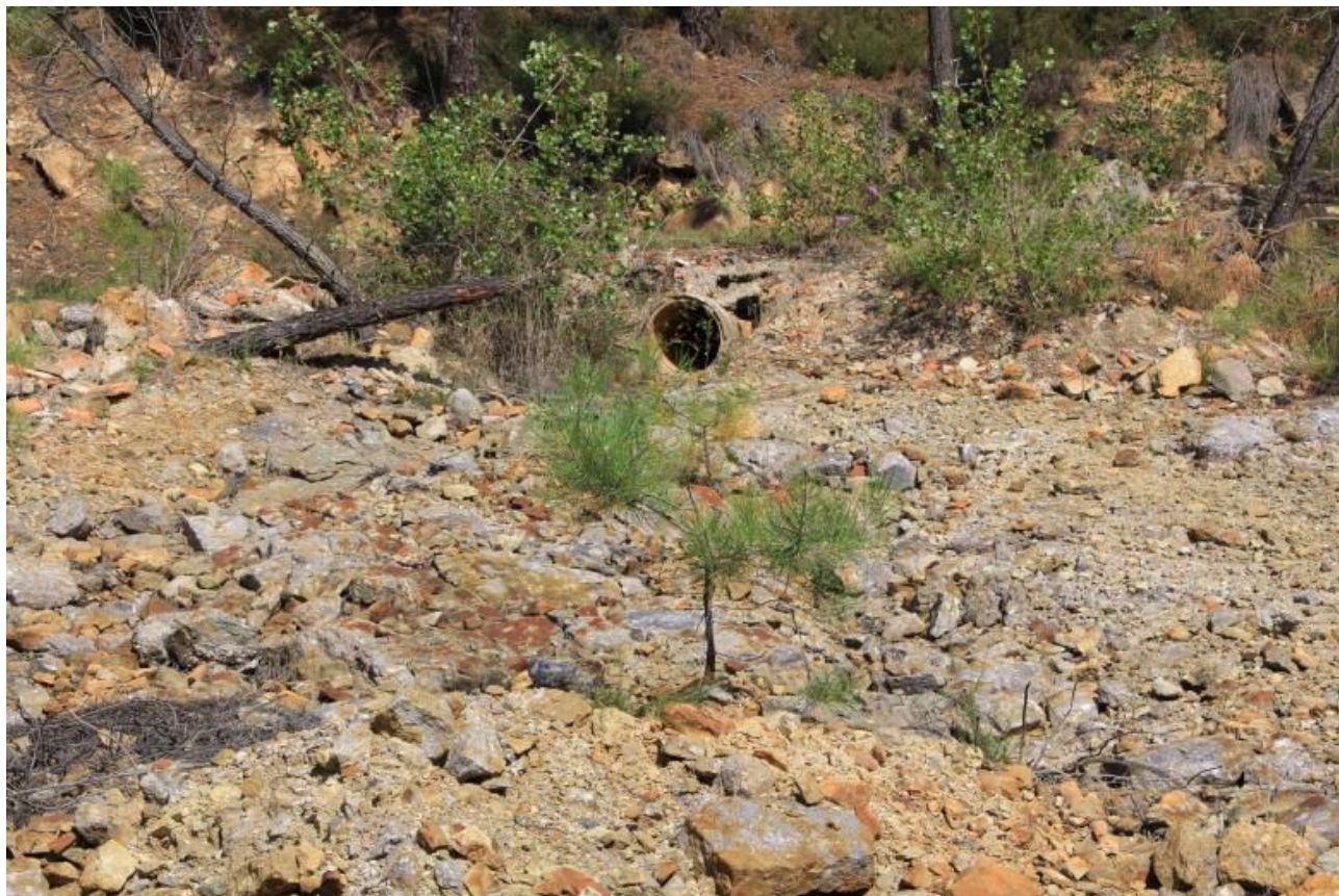
Page 75 Photo 43 – Buse rejetant les eaux de la route sur le 1 er carreau d'exploitation