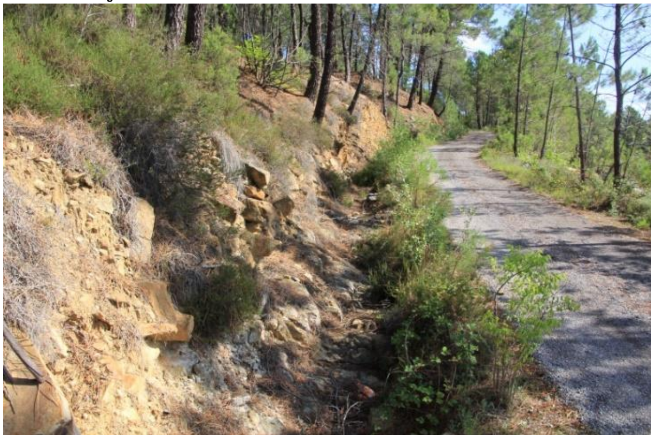
Page 73 Photo 37 – Fossé le long du tronçon au-dessus du 1 er carreau d'exploitation