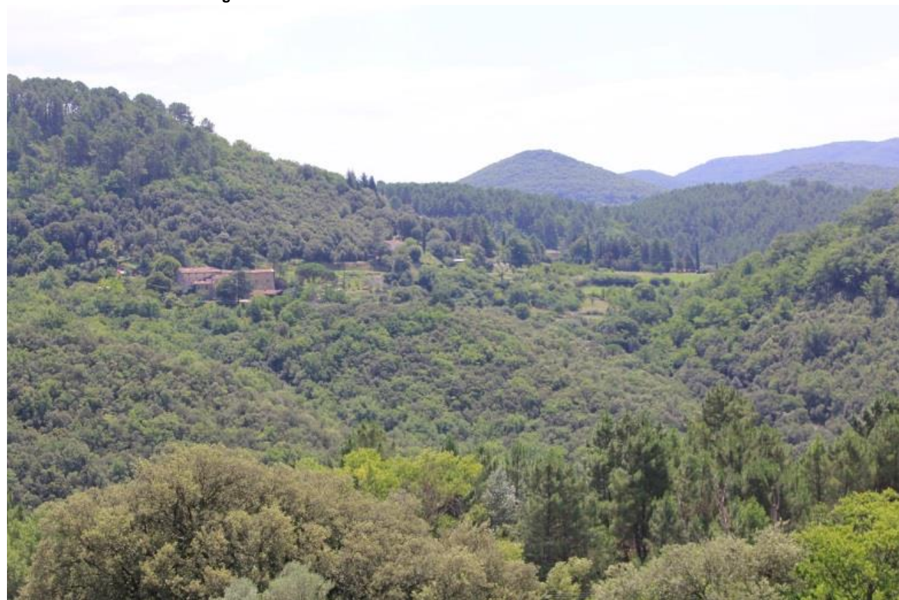
Page 64 - Photo 25 – Versant est du Réigoux couvert de feuillus