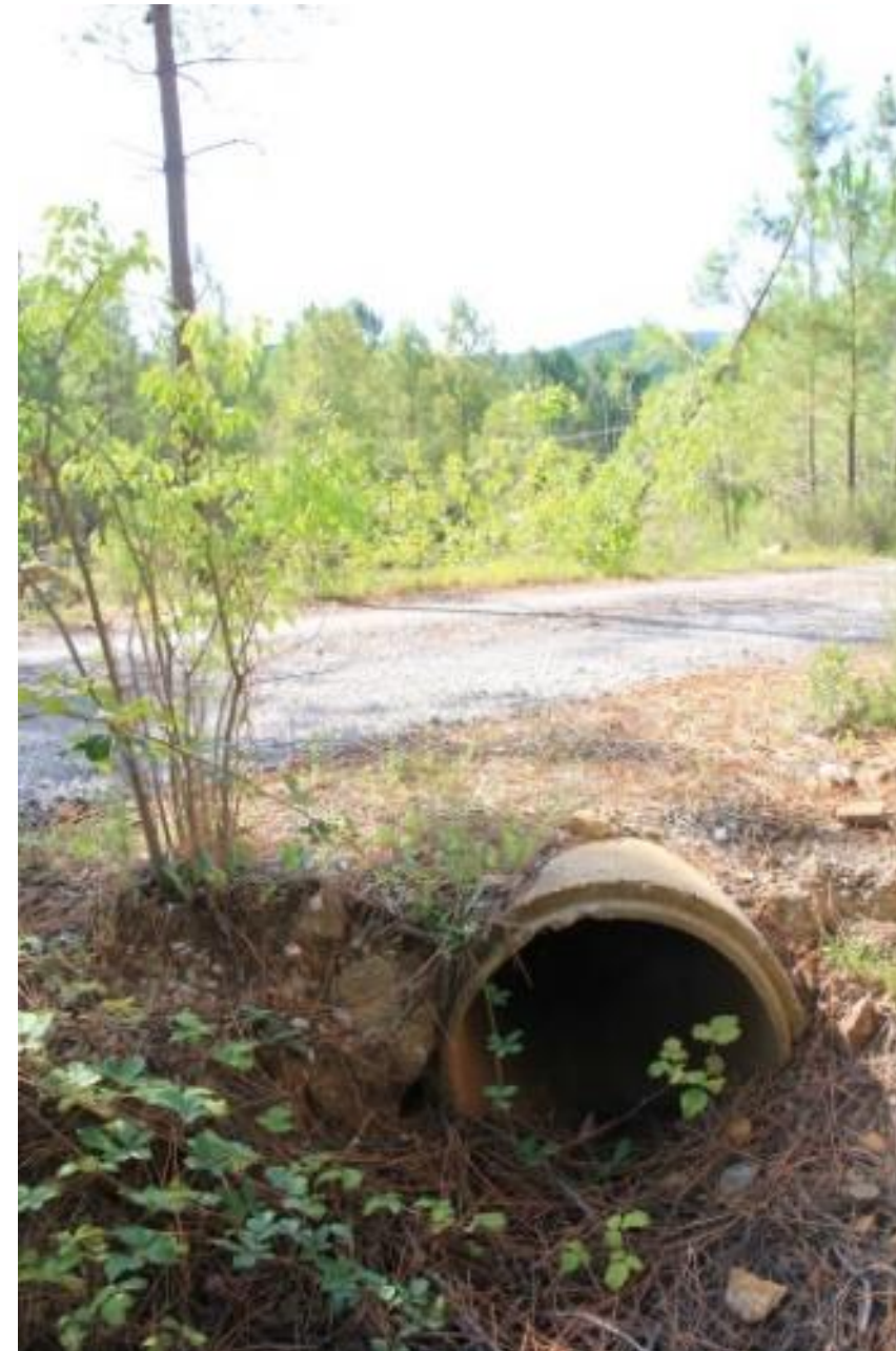
Page 73 Photo 38 – Buse au-dessus du 1 er carreau d'exploitation