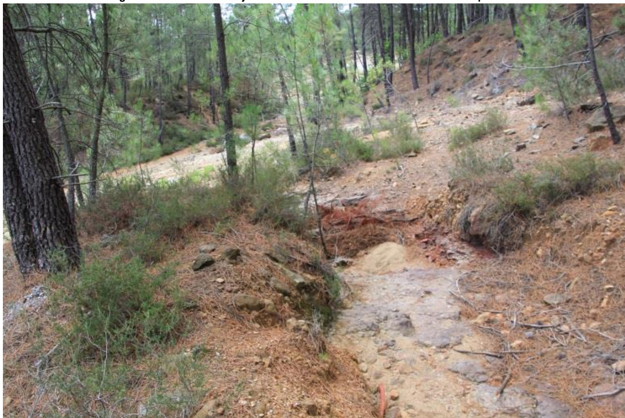
Page 75 Photo 44 – Fossé rejetant les eaux de la route sur le 2 ème carreau d'exploitation