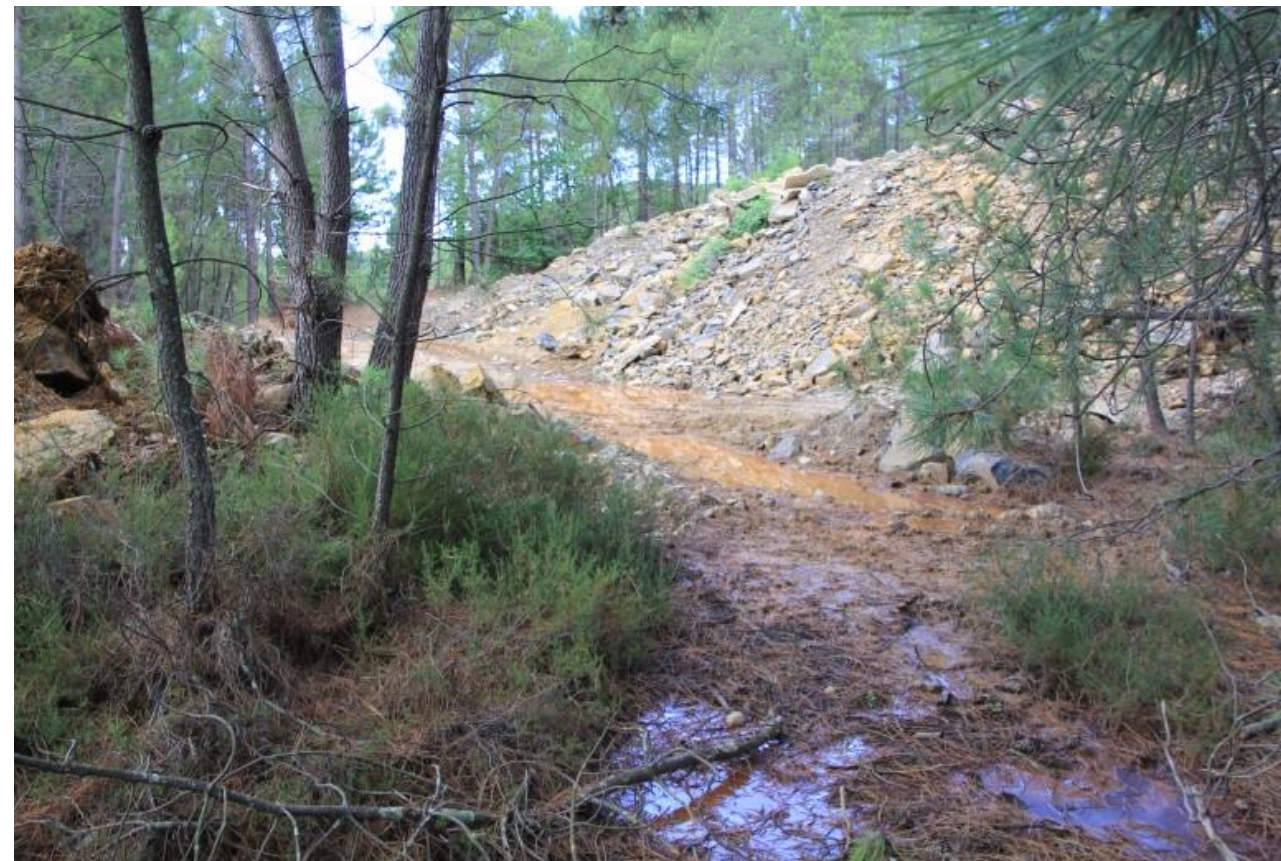
Page 74 Photo 41 – Ecoulement le long des pistes sur le 1 er carreau d'exploitation