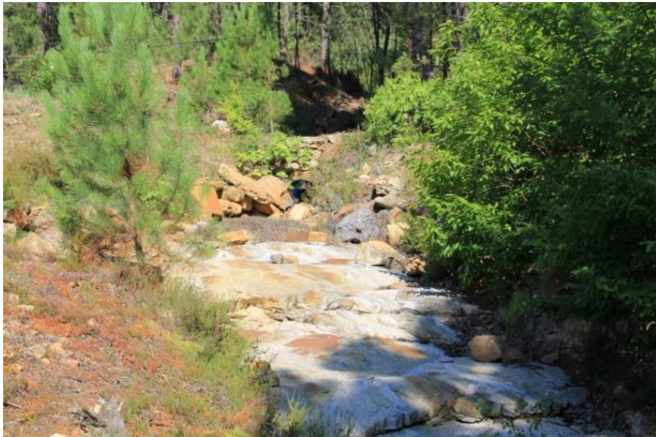
Page 73 Photo 36 – Ravine renforcée à la limite de la station de retraitement des eaux usées