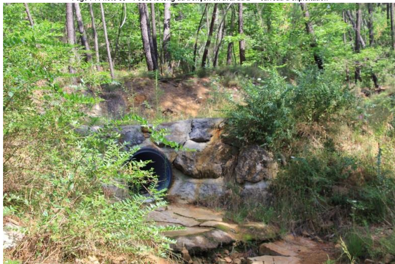
Page 74 Photo 40 – Buse sur le tronçon en aval du 2 ème carreau d'exploitation