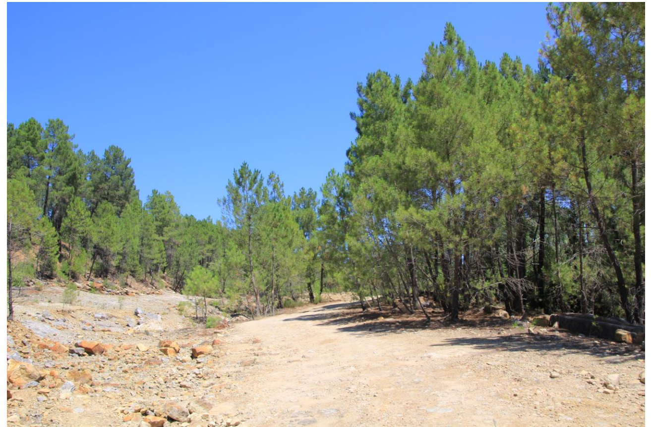
Page 61 - Photo 22 – Sol du carreau d'exploitation sud