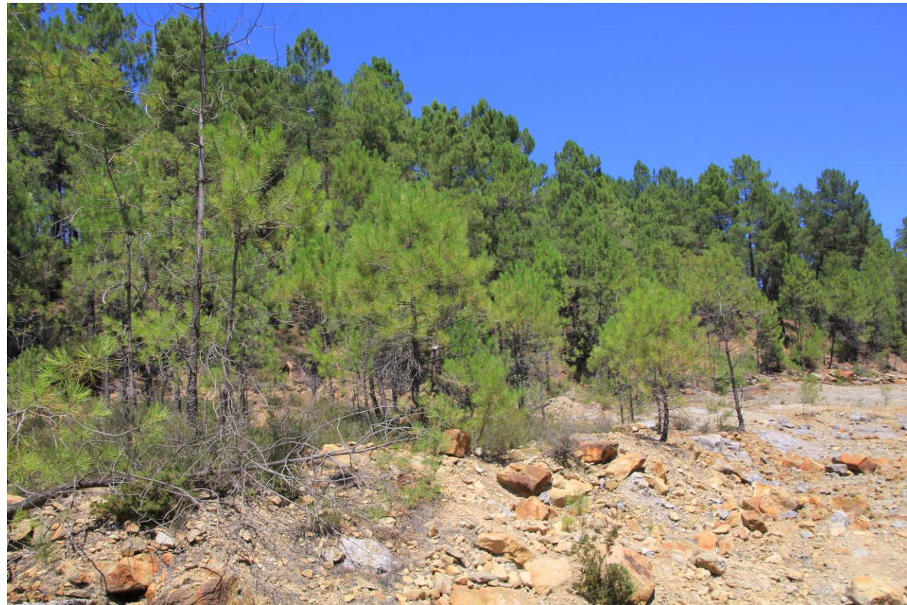
Page 59 - Photo 20 – Zone faiblement végétalisée à pente très faible