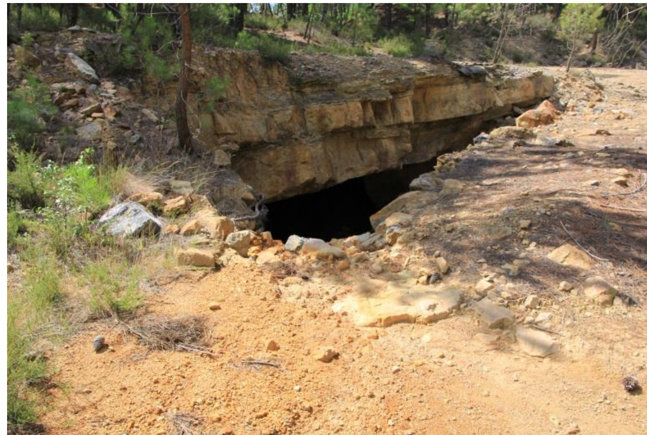
Page 75 Photo 45 – Ruissellement capté par une galerie de mine