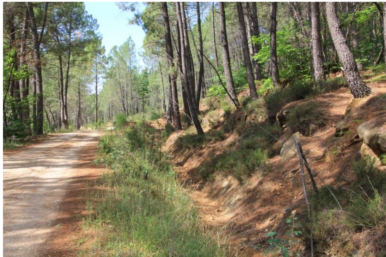
Page 74 Photo 39 – Fossé le long du tronçon en aval du 2 ème carreau d'exploitation