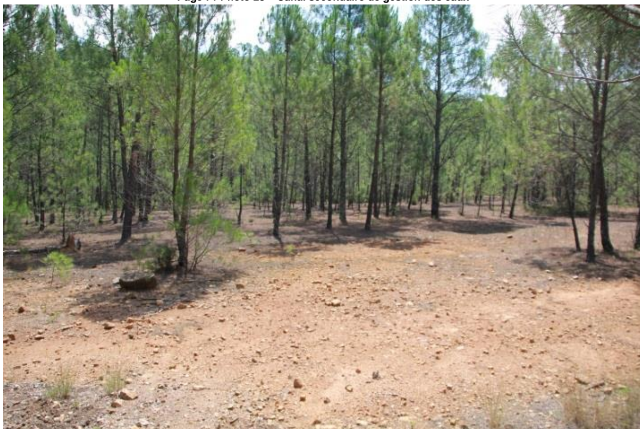
Page 71 Photo 29 – Vue de la verse à stérile