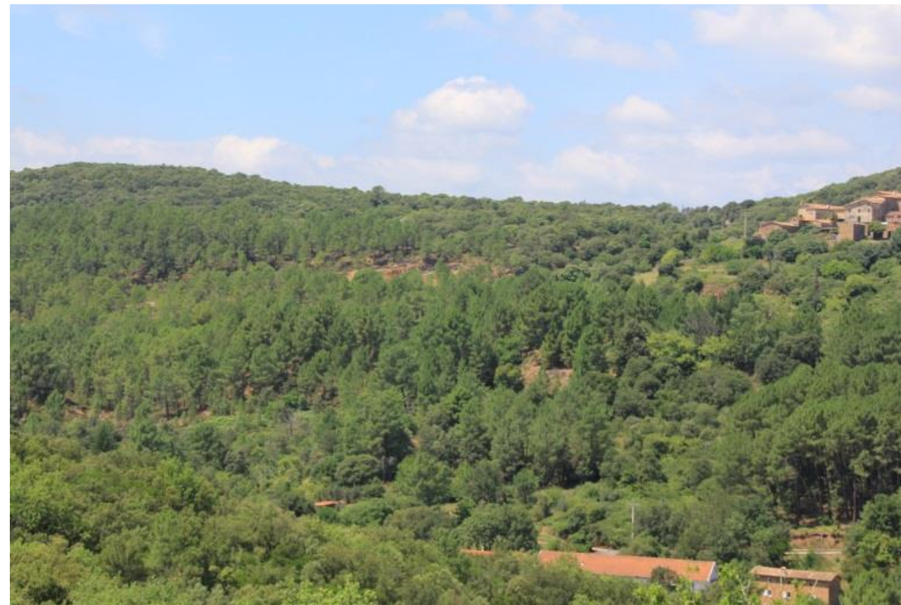
Page 64 - Photo 26 – Versant ouest du Réigoux couvert de conifères (Pins maritimes)