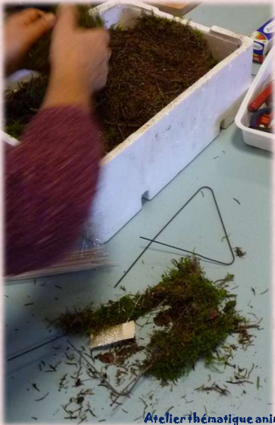
Atelier thématique animé par Dominique Ferrier