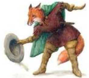
Rusé comme un renard (Image du célèbre goupil : Renart)

- Renart , le personnage principal connu sous le nom de « goupil ». Renart est malicieux et rusé. Parfois, il est le redresseur de torts tel Zorro (renard en espagnol) ; d'autres fois, c'est lui le démon. Renart utilise la ruse intelligente, l'art de la belle parole. On l'appelle « le maître des ruses ».