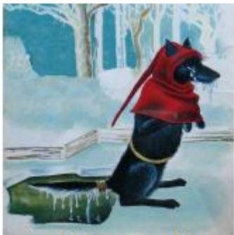
La pêche aux anguilles : Ysengrin pris dans la glace.

- Ysengrin , le loup, est l'éternel ennemi de Renart, son neveu. Ysengrin se fait toujours duper. Son épouse est Dame Hersent , une louve.