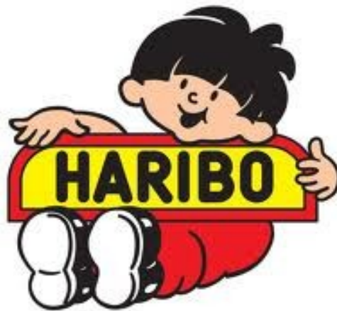
Logo de Haribo

Hans Riegel crée une petite entreprise de bonbon qu'il nomme Haribo, reprenant ainsi les deux premières lettres de son prénom, de son nom et de sa ville, à savoir Bonn . Avec l'invention de « l'ours dansant » en 1922, l'entreprise prend de l'ampleur et croît de plus en plus vite. A la veille de la guerre, elle emploiera 400 personnes.