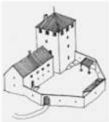
Evolution du XIIIe au XVIe siècle

J'identifie les nouveaux éléments du château fort à chaque période observée en les coloriant en vert :