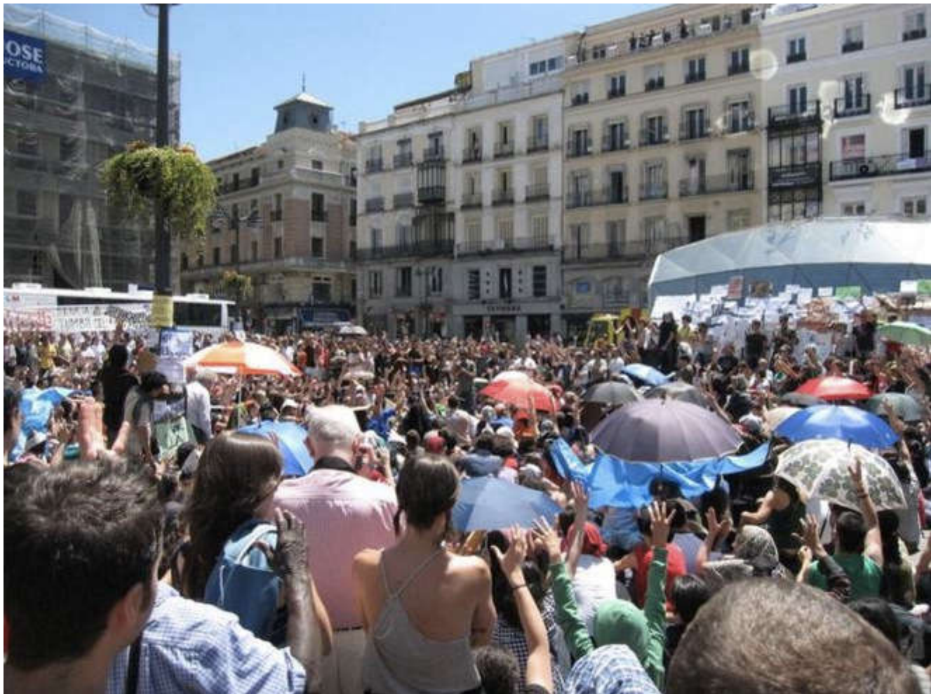
Puerta del Sol, Madrid, 2011