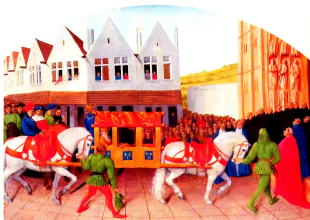
Un déplacement en litière

Au Moyen Âge, la plupart des gens effectuent des trajets à pied. Les plus fortunés (nobles, commerçants, prêtres) se déplacent régulièrement à dos de cheval, et parfois en charriot ou sur une litière portée par des chevaux.