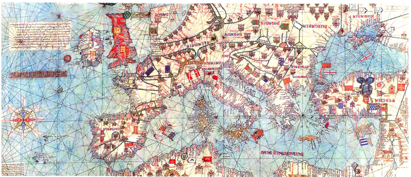
Un exemple de portulan du XIV e siècle