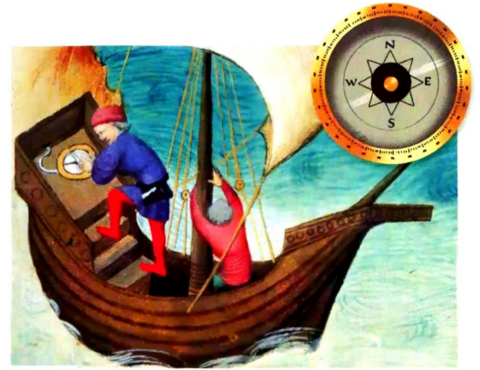
La navigation à la boussole au XIV e siècle

À cette époque, les marins naviguent à proximité des côtes. En notant leurs observations et en faisant des relevés à l'aide de ces nouveaux instruments, ils établissent les premières cartes de navigation, appelées «portulans ». Elles leur permettent de se repérer et de naviguer en sécurité.