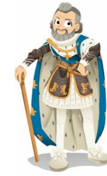
Henry IV 1589 - 1610