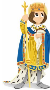
LOUIS IX 1226 - 1270