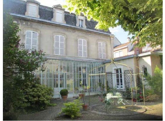
2 Vieille maison de centre ville