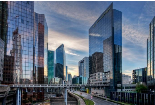
5 Quartier d'affaires moderne (Paris)