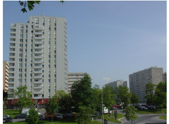
4 Grands immeubles