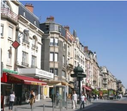
3 Immeubles centre ville