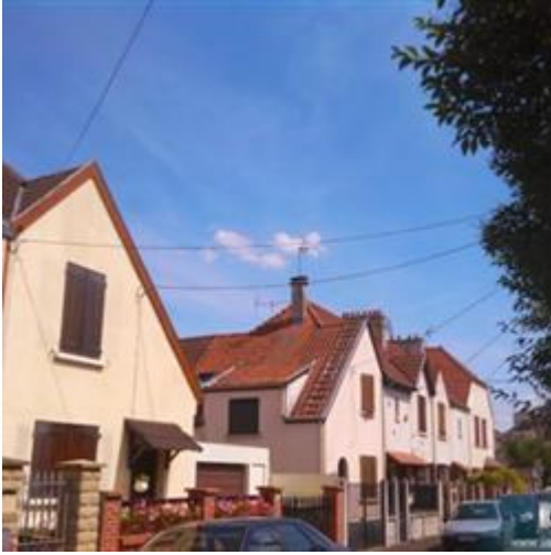
1 Zone pavillonnaire