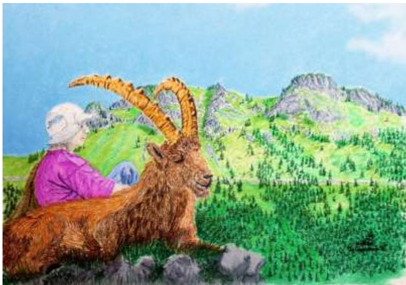
Pastel sur Arches LM