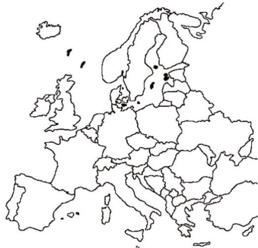
Mon continent : l'Europe