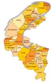
Mon département : Hauts-de-Seine