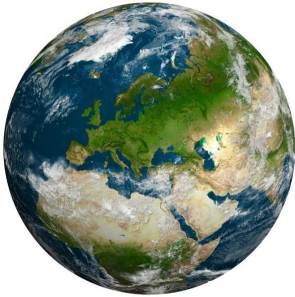
Ma planète : la Terre