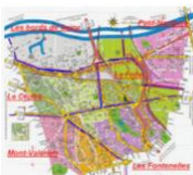
Ma ville : Nanterre