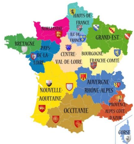
Mon pays : la France