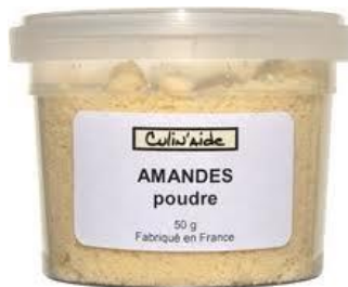
de la poudre d'amande