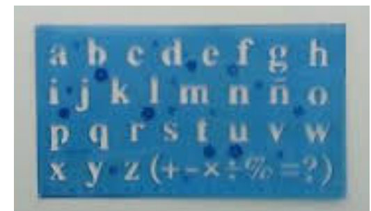
Formographe des lettres