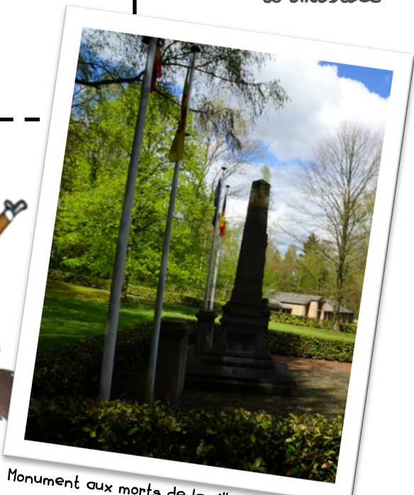
Monument aux morts de la ville de Rixensart