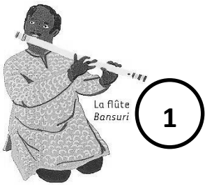
La flûte Bansuri

Grâce à sa fortune, Devdas le rusé resta un paresseux ! Il ne devint ni un grand coiffeur ni un grand cultivateur mais il vécut sans travailler et parfaitement heureux [...] ○○○○