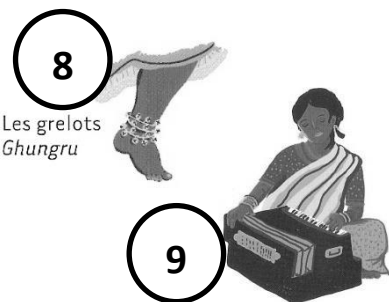
Les grelots Ghungru