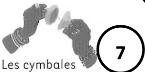
Les cymbales Krotales