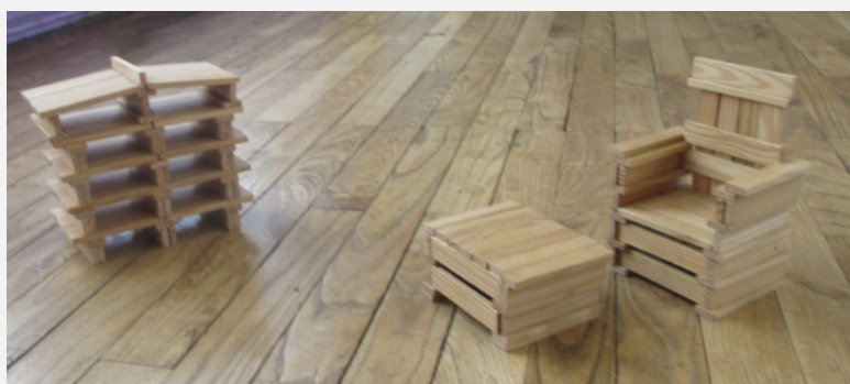
Des constructions en kapla. Bravo les ébénistes !