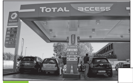
Doc. 3 Une station essence à Lyon.