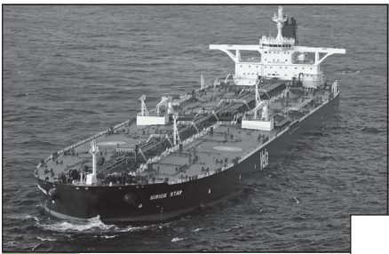
Doc. 4 Un tanker sur l'océan Atlantique.