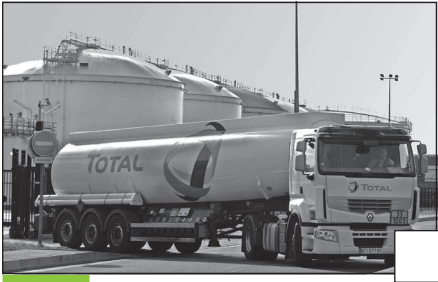
Doc. 1 Un camion-citerne à la sortie du dépôt pétrolier de Gennevilliers.