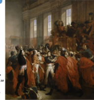
Le général Bonaparte au coup d'état du 18 brumaire de l'an VIII (9 novembre 1799) par Pierre-Thomas LeClerc, 22 novembre 1799, musée de la Ville de Paris, Paris

Doc A Le coup d'état du 18 brumaire de l'an VIII (9 novembre 1799)