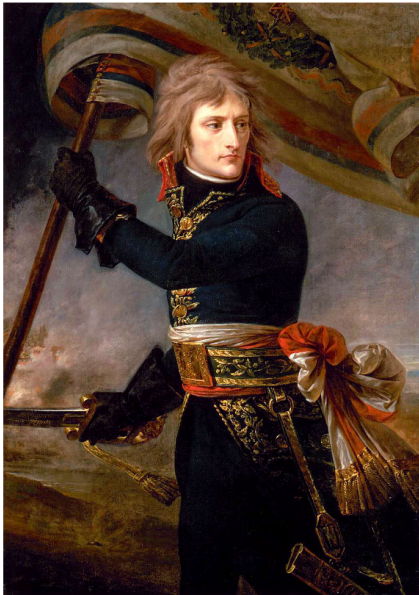
Bonaparte au pont d'Arcole lors de la campagne d'Italie en 1796 par Antoine-Jean Gros musée national du château de Versailles