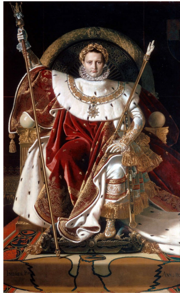
Napoléon sur le trône impérial en 1806 par Jean-Auguste-Dominique Ingres musée de l'armée