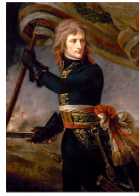
Napoléon au port d'Arcole lors de la campagne d'Italie en 1796 par Antoine-Jean Groux